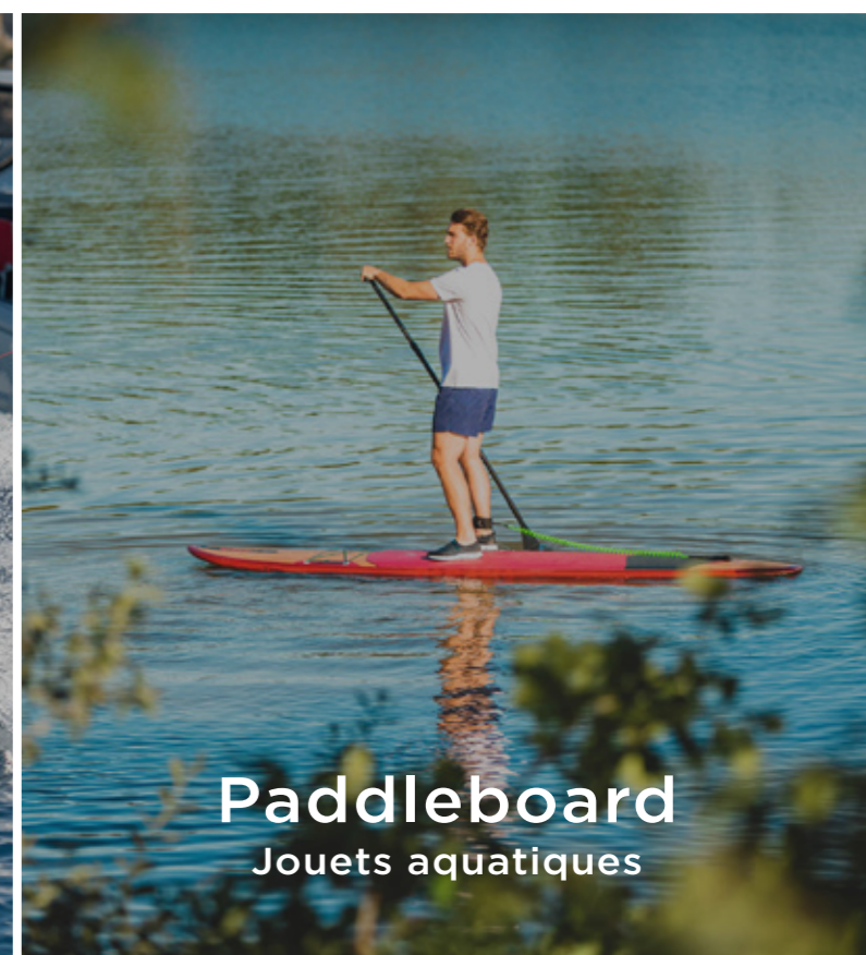
Paddleboard Jouets aquatiques