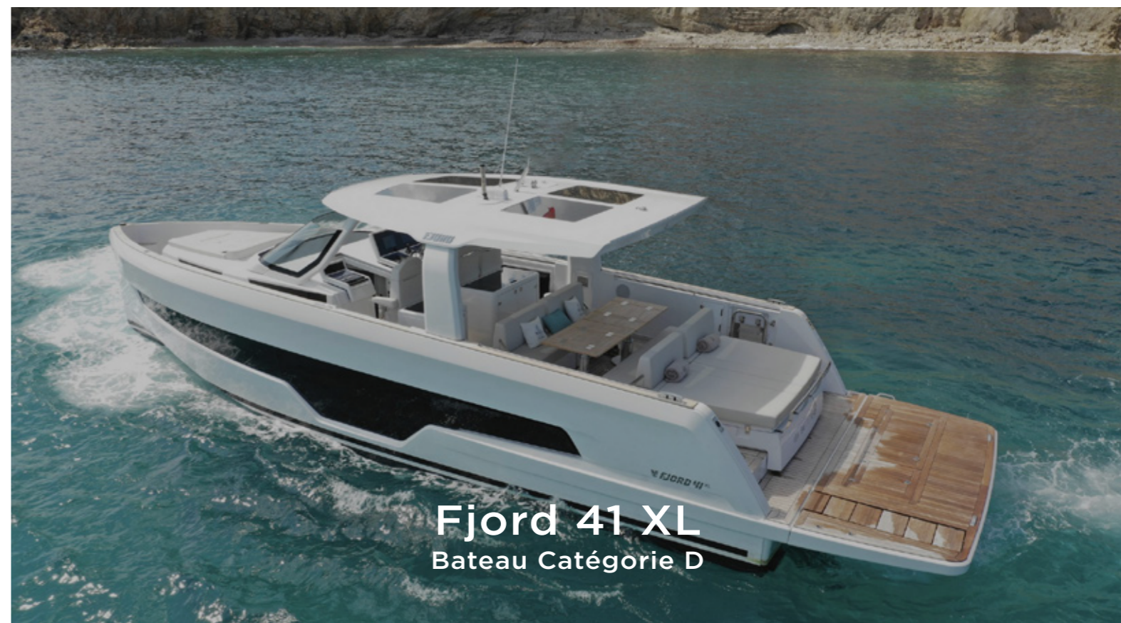
Fjord 41 XL Bateau Catégorie D