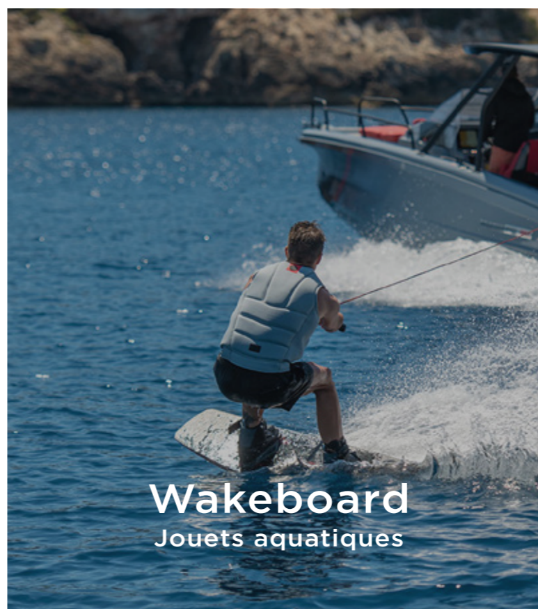
Wakeboard Jouets aquatiques