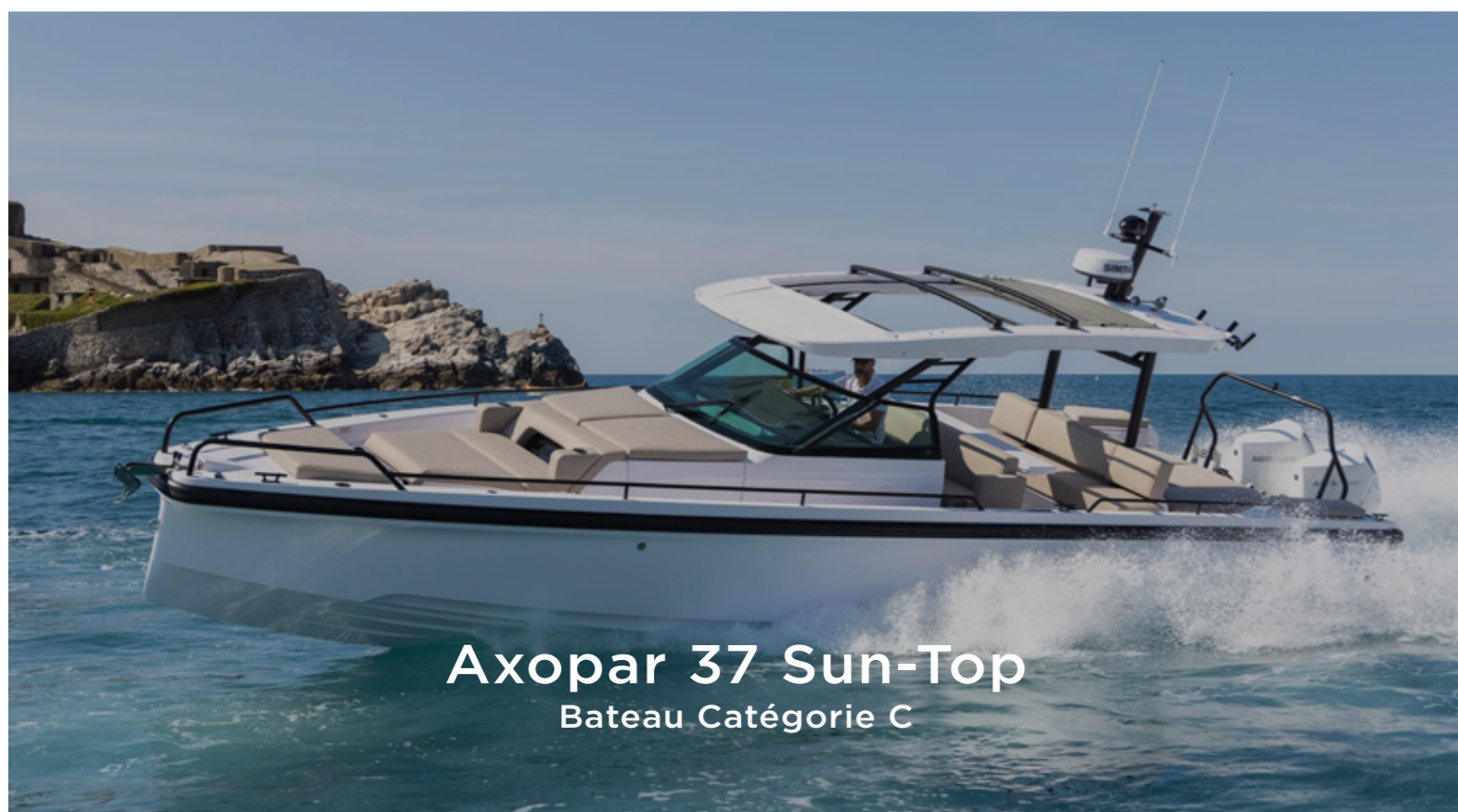
Axopar 37 Sun-Top Bateau Catégorie C