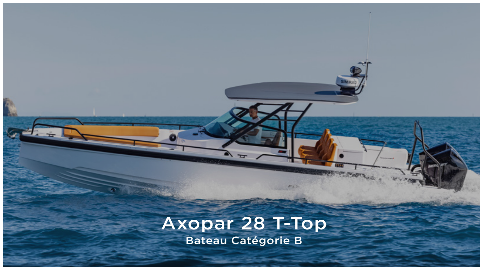
Axopar 28 T-Top Bateau Catégorie B