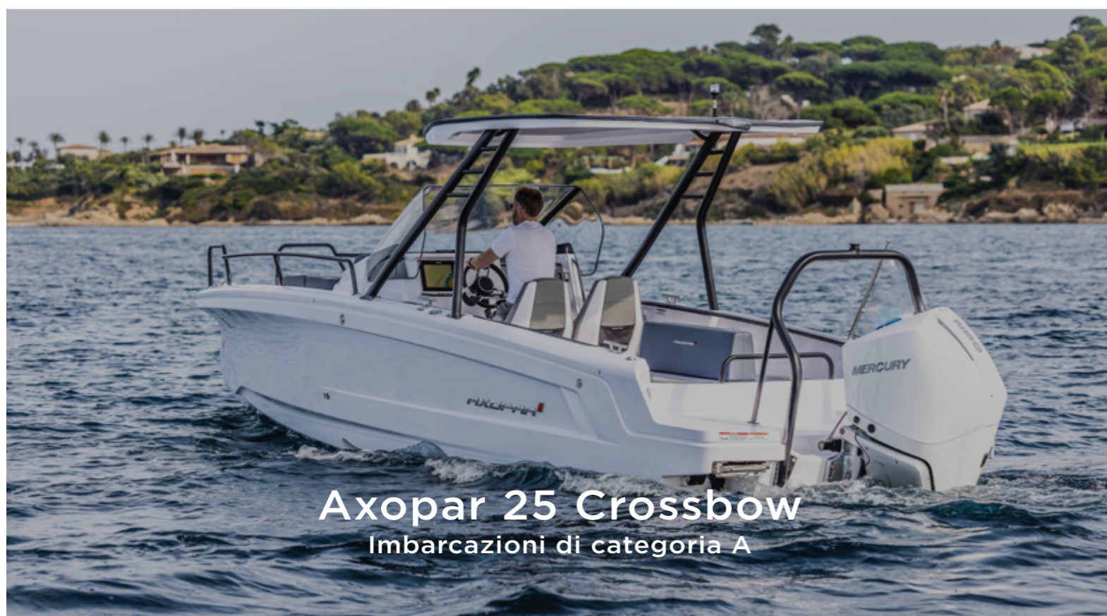
Axopar 25 Crossbow Imbarcazioni di categoria A