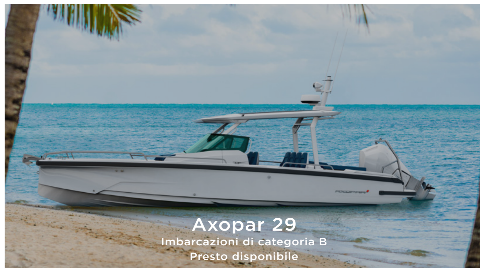
Axopar 29 Imbarcazioni di categoria B Presto disponibile