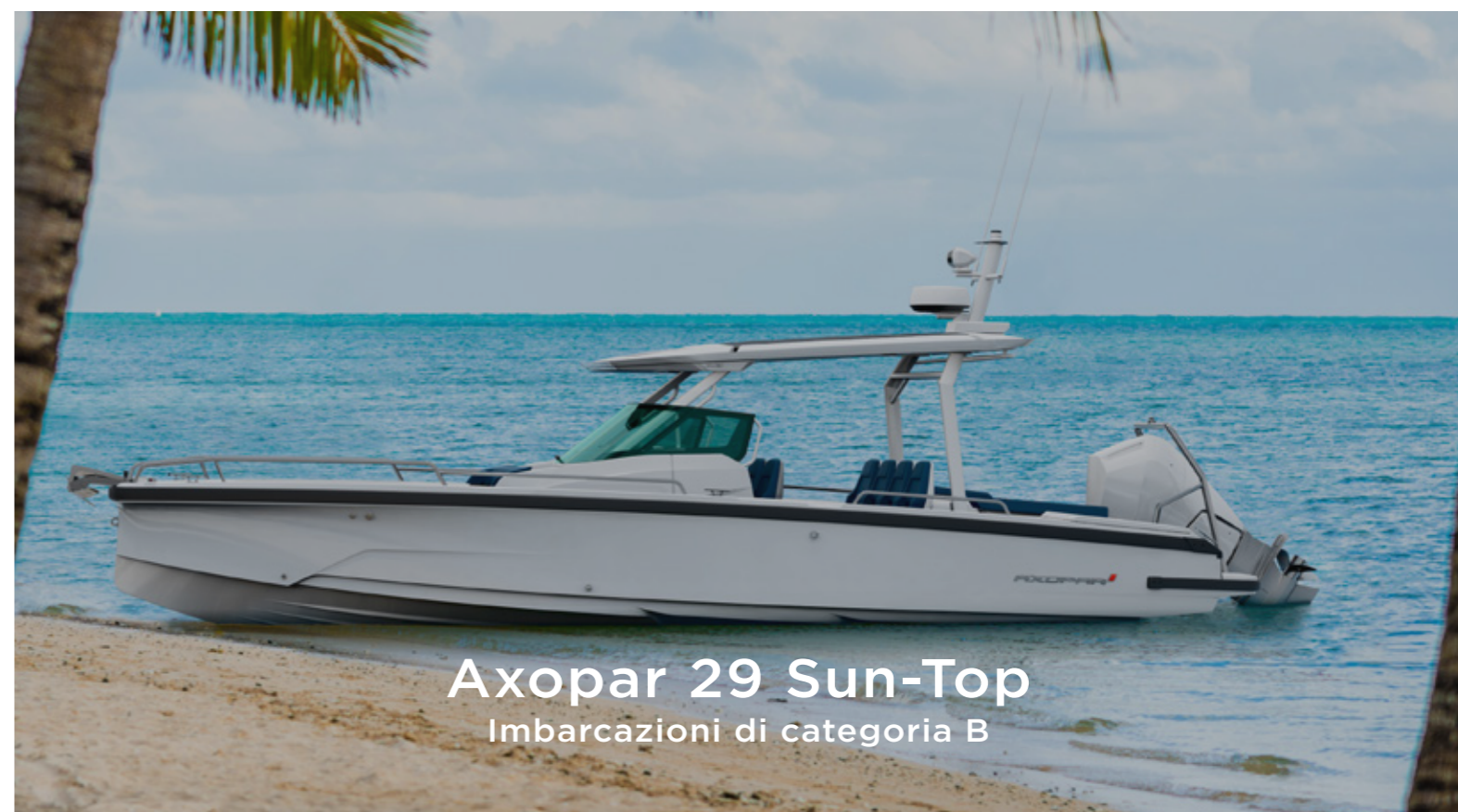
Axopar 29 Sun-Top Imbarcazioni di categoria B