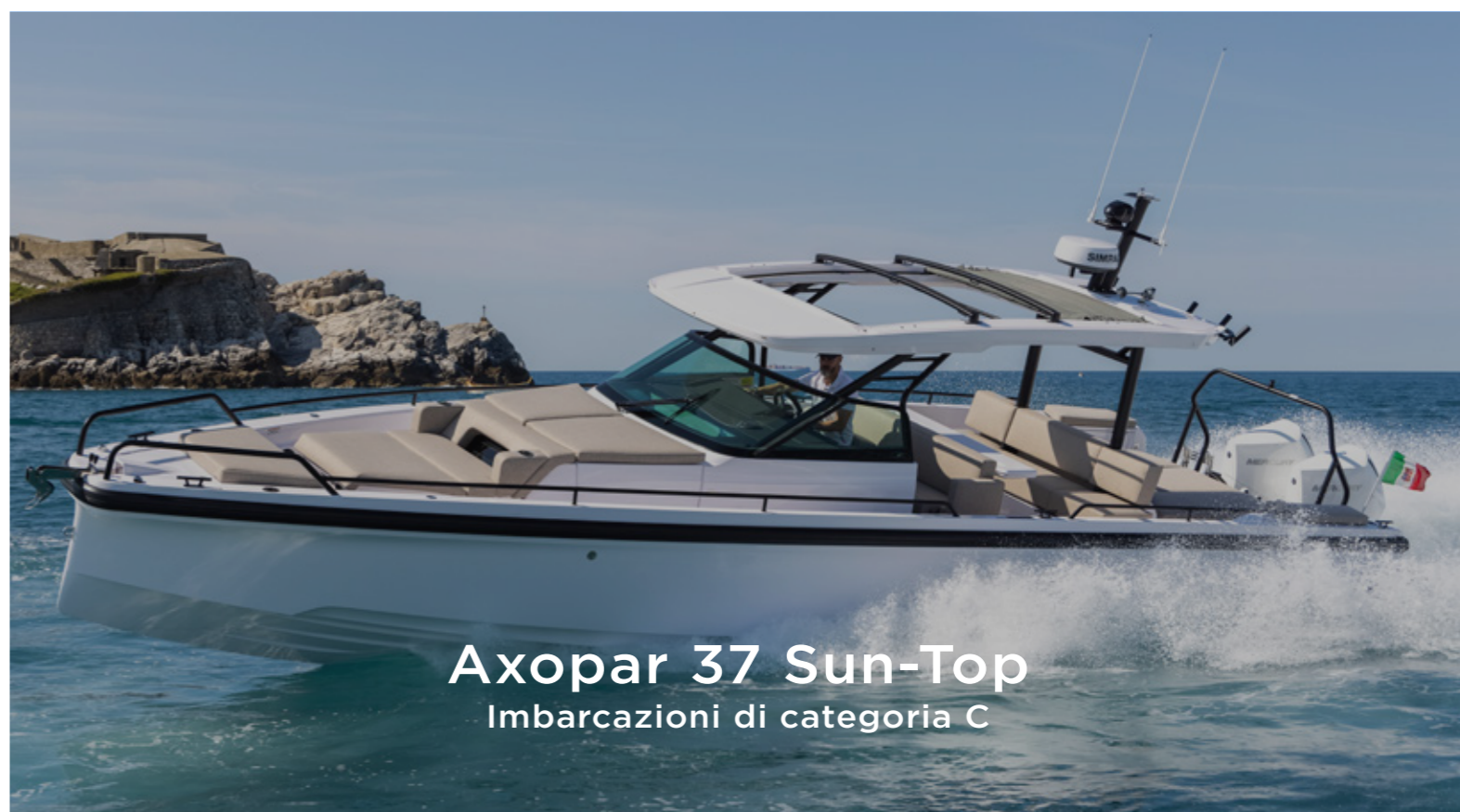
Axopar 37 Sun-Top Imbarcazioni di categoria C