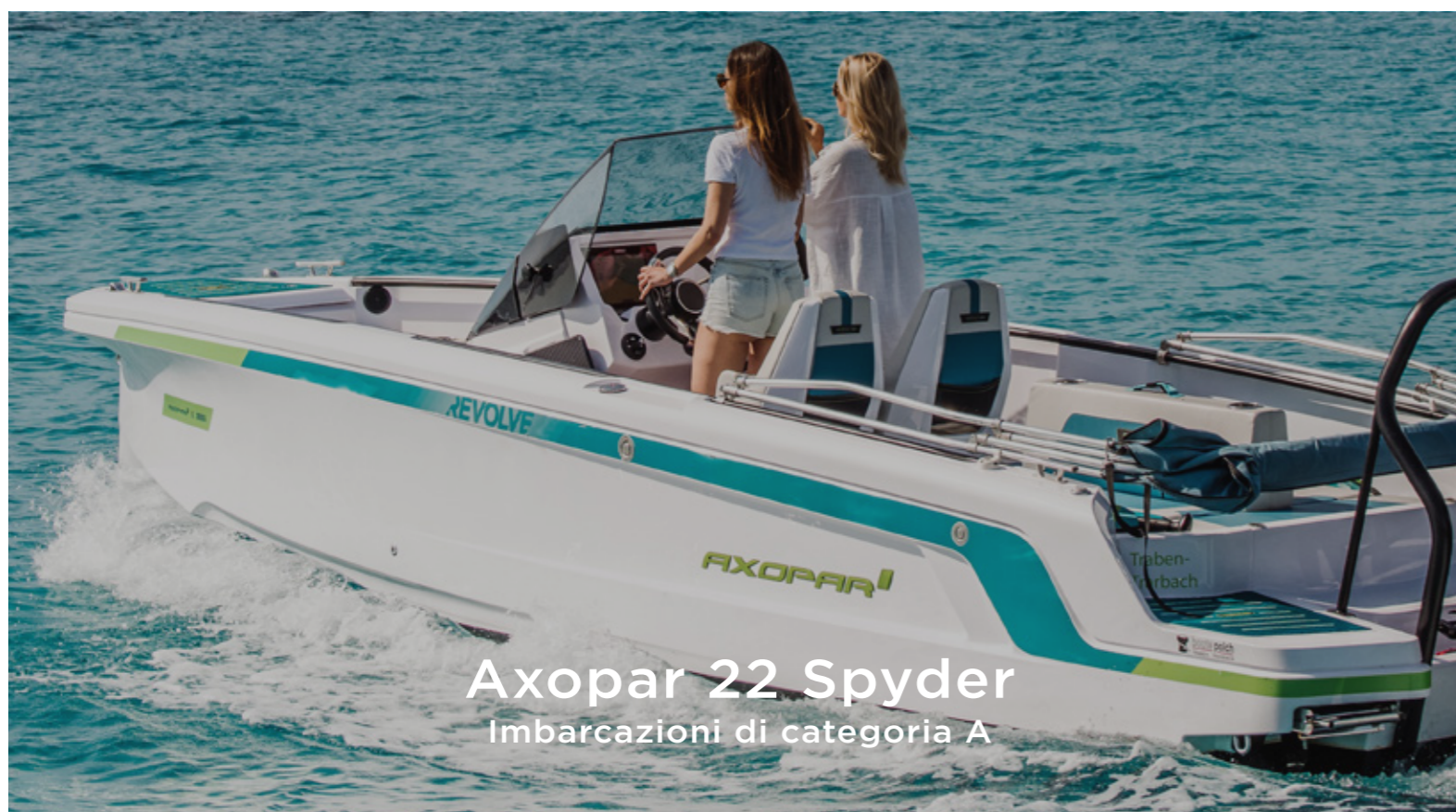
Axopar 22 Spyder Imbarcazioni di categoria A