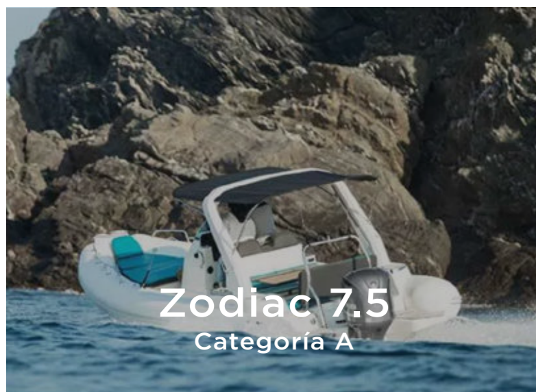
Zodiac 7.5 Categoría A