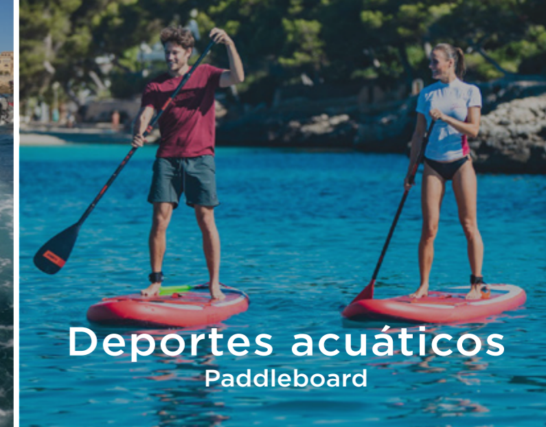
Deportes acuáticos Paddleboard