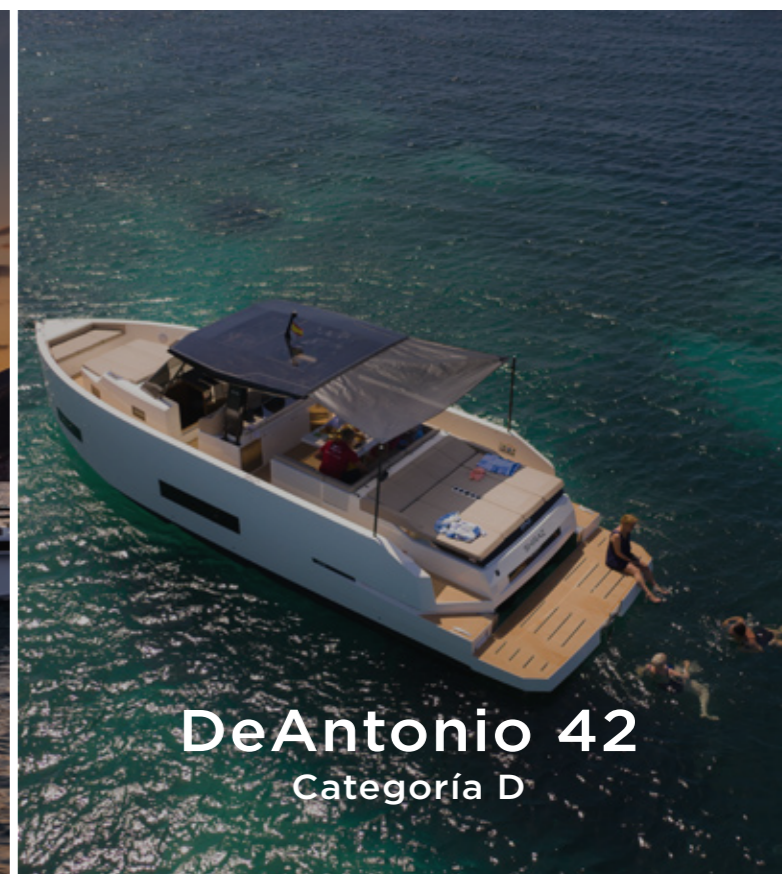
DeAntonio 42 Categoría D