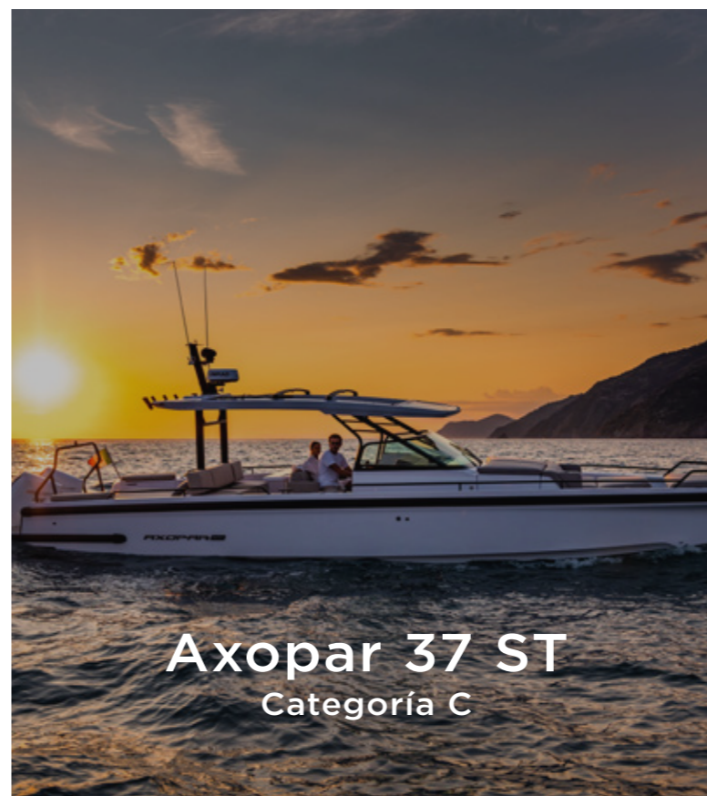
Axopar 37 ST Categoría C