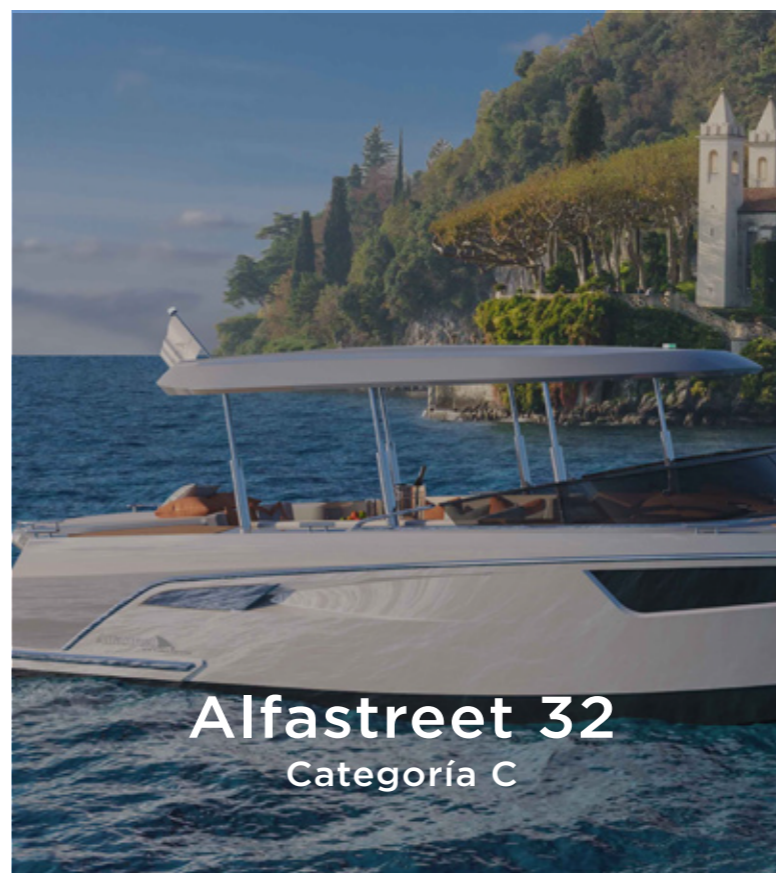
Alfastreet 32 Categoría C