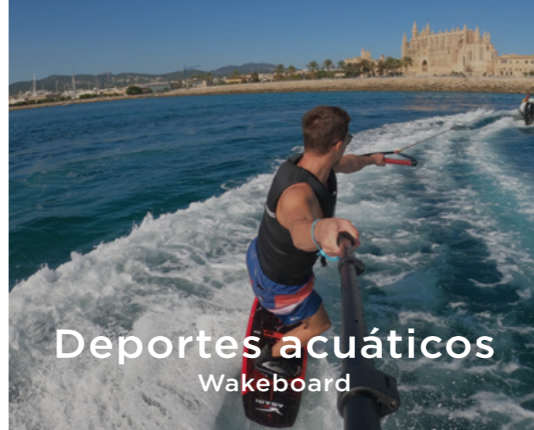
Deportes acuáticos Wakeboard