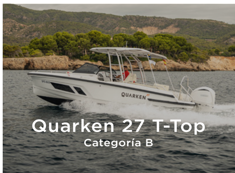
Quarken 27 T-Top Categoría B