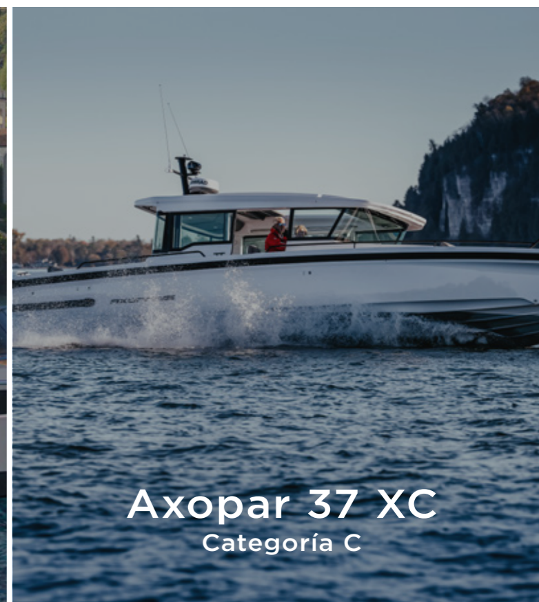
Axopar 37 XC Categoría C