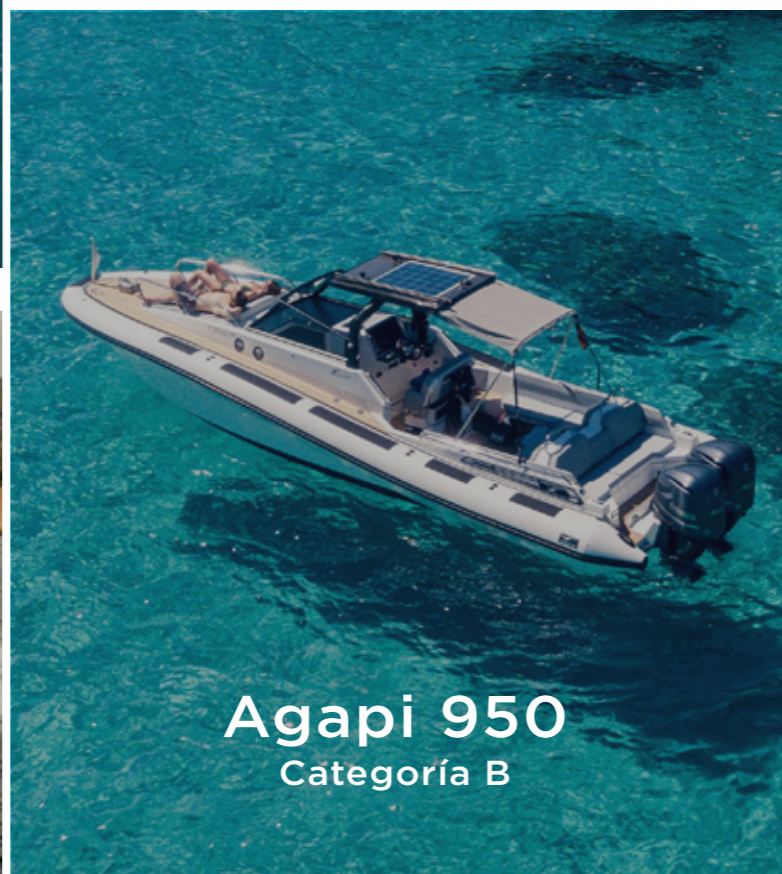
Agapi 950 Categoría B