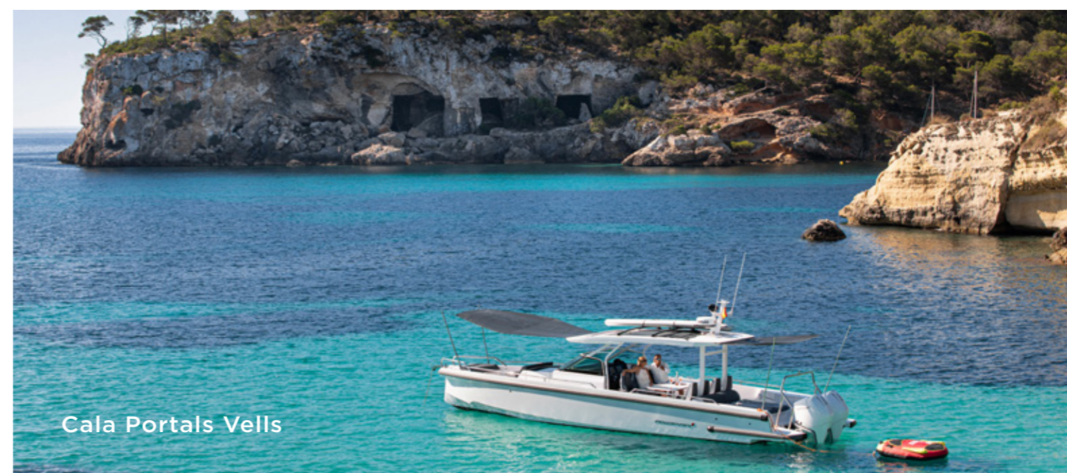
Cala Portals Vells