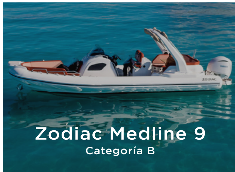
Zodiac Medline 9 Categoría B