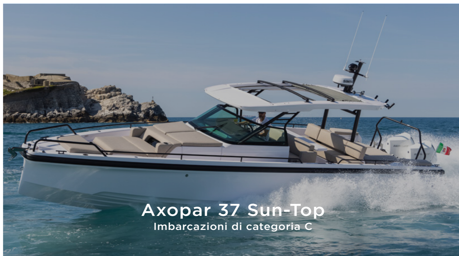
Axopar 37 Sun-Top Imbarcazioni di categoria C