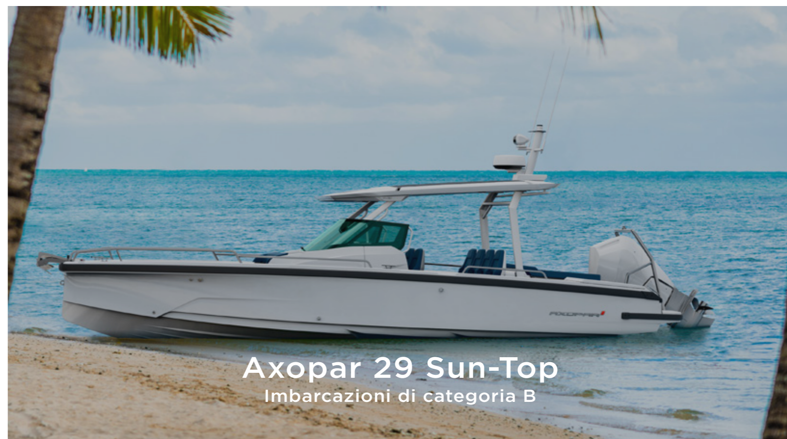
Axopar 29 Sun-Top Imbarcazioni di categoria B