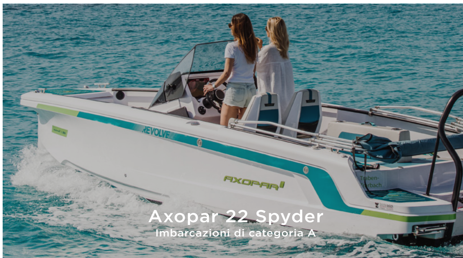
Axopar 22 Spyder Imbarcazioni di categoria A