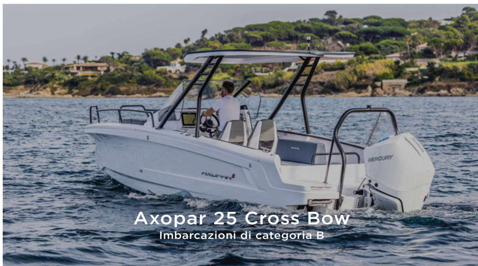
Axopar 25 Cross Bow Imbarcazioni di categoria B